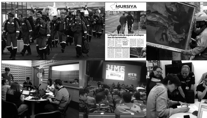
Imagen 4. Cobertura del Ejercicio Conjunto Combinado UME-Región de Murcia.

difusión de contenido propio o ajeno (Martínez-Rodríguez; Torrado-Morales 2022).