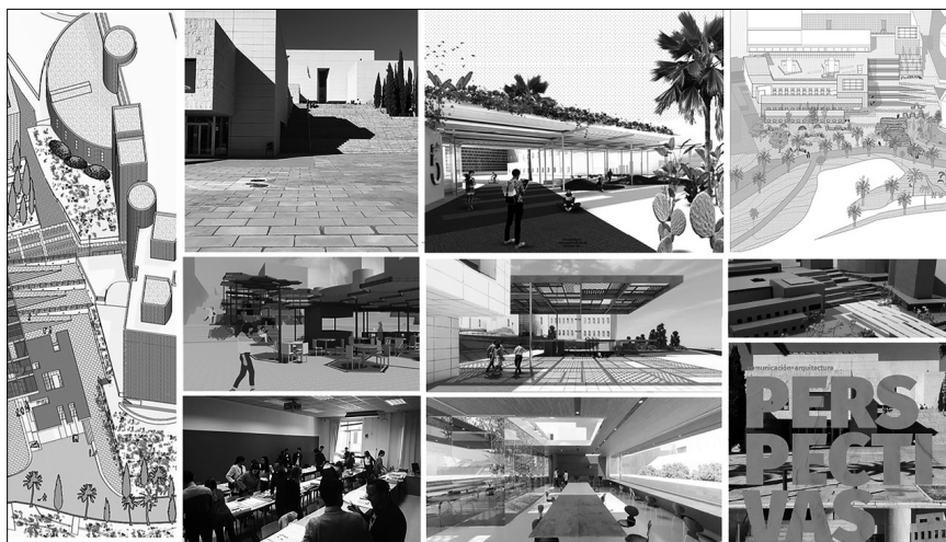
Imagen 1. Proyecto Perspectivas.

y arquitectónicas para transformar la plaza Periodista Jara Carrillo, ubicada junto a la Facultad, en un espacio vital para la convivencia entre las personas que desarrollan su actividad académica o profesional en dicho centro o en las cercanías, que permitiera proyectar la facultad como un punto de encuentro central del campus (Fernández; Carcelén, 2019). Las actividades de nuestro grado estuvieron encaminadas a definir los espacios y las instalaciones desde planteamientos de comunicación que permitieran conceptualizar propuestas, ideas descritas en proyectos concretos que canalizaron esfuerzos hacia la creación de proyectos arquitectónicos tangibles y realizables (Imagen 1).