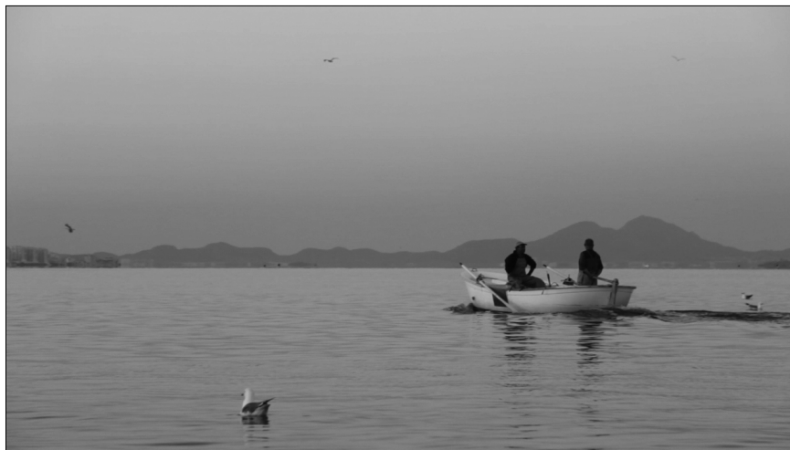
Imagen 2. Imagen del largometraje Memorias del Mar Menor. La pesca en un paisaje en crisis .

perspectivas críticas, paralelismos y marcos de actuación coincidentes en torno a la interpretación historiográfica y el análisis fílmico en una actividad de carácter voluntario, ofertada al alumnado matriculado en las respectivas asignaturas implicadas. Los mejores ensayos de Murcia y Birkbeck se han publicado en versión bilingüe, en la web Educación la mirada . 6 La metodología colaborativa y participativa empleada en este proyecto ha fomentado y dinamizado el aprendizaje multidireccional.