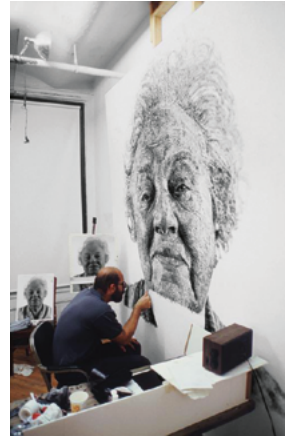
Jan van der Straet, Stradanus, plancha nº 19, (ca. 1600). Talla dulce, 20.2 × 27.1 cm. Metropolitan Museum of Art, Nueva York. | Chuck Close trabajando en «Fanny» , 1985. Óleo sobre lienzo realizado a partir de huellas dactilares.

Hasta aquí el grabado. Hay otras técnicas gráficas en las que no existe una diferencia física, de nivel, entre las zonas con y sin imagen, sino que estas se establecen por una diferencia química. La litografía, principal sistema planográfico, se funda en el natural rechazo entre la grasa y el agua originando zonas con imagen encrófilas, o receptoras de tinta, y zonas blancas receptoras de agua (o hidrófilas). Durante el entintado se humedece la piedra con una esponja para que las zonas blancas repelan la tinta adherida al dibujo que ha hecho previamente el artista.