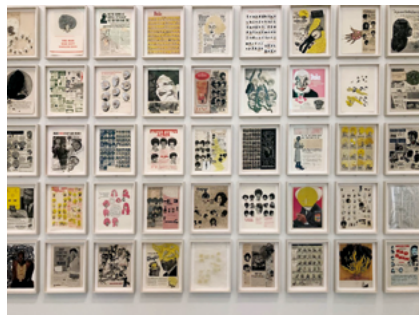
Robert Rauschenberg fotografiado por Henri Cartier Bresson, Nueva York, 1968. | Colectivo Textil. 60 estampas en varias técnicas, 13 × 10 cm c. u. Exposición Arte y Feminismo , University of California, Berkeley Art Museum & Pacific Film Archive. BAMPFA, 2002.

descentralización de la matriz y la adaptación del formato expositivo lo funden con el resto de las actividades artísticas. Las posturas más vanguardistas cuestionan cualquier concepto asentado en la objetualización de la estampa y los mensajes se profundizan para responder a las demandas de la sociedad contemporánea. Comprender la gráfica hoy obliga a realizar un importante ejercicio de aperturismo y adaptación a un cambio que lo ha transformado todo. La tinta, la matriz y el papel pueden ser sustituidos por otros materiales.