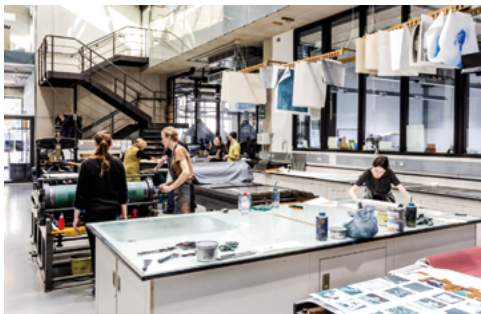
Taller calcográfico de la Facultad de Bellas Artes de la Universidad de Sevilla, 2020. | Estudiantes trabajando en el Wolfson Printmaking Hall, The Royal College of Art, Dyson Building, 2015.

artista se mueve por emociones y las emociones llevan a los comportamientos que guían la creación y el método. Recuerdo un ejemplo de una alumna que procedía de una familia desestructurada y arrastraba problemas psicológicos importantes. En su modo de estampar se podía ver una desgana que contrastaba con la intención y la extrema sensibilidad de sus grabados. La enseñanza debe fundarse en los beneficios del diálogo y, a veces, un diálogo en el plano emocional atendiendo a lo periférico tiene más efectos que cualquier explicación técnica.