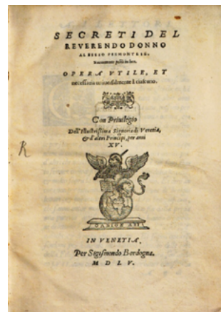
Carnet de estudiante de Salvador Dalí. Escuela de Bellas Artes de San Fernando (Madrid), 1924-1925. The Dalí Museum, San Petersburgo, Florida. | Ruscelli, Girolamo, portada de Secreti del Reverendo Donno Alessio Piemontese , 1555, Venecia. Munich, Bayerische Staatsbibliothek.

entrenados. Cuando reflexionan delante de su estampa los argumentos estéticos se les escapan y la juzgan con escuetas valoraciones técnicas acerca del procedimiento.