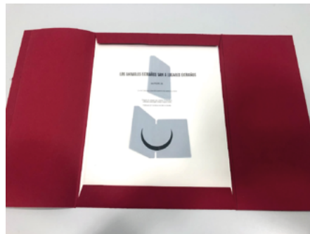
Pepe Domínguez, Los animales extraños van a lugares extraños , 2019. Monotipo.

nos grabado que el grabado de otros, dónde comienza su dibujo y dónde su estampación?