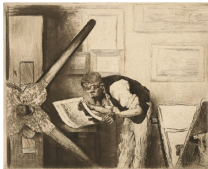
Sir Hubert von Herkomer, Dos impresores en el taller , 1891. Aguafuerte y punta seca, 15,2 × 20 cm. British Museum, Londres. | Norbert Goeneutte, Henri Gerard en su prensa , 1888. Aguafuerte, punta seca, aguatinta y ruleta. 28,4 × 37,8 cm. Van Gogh Museum, Ámsterdam.

teriales, los procesos, las personas y sus maneras a un nivel de profundización extraordinario. 2 Este tipo de investigación histórica y bibliográfica sobre las técnicas de estampación es imprescindible para hacer una puesta al día de los conocimientos. Su inigualable aportación a la historia de las técnicas del grabado permite a los investigadores conocer cuál es el estado de la cuestión hasta el año 2000. Sobre este particular reflexiona Juan Carrete Parrondo cuando expresa que «es sobradamente conocido que los repertorios bibliográficos sobre cualquier ciencia o tema son instrumentos fundamentales para el avance de estas.» 3