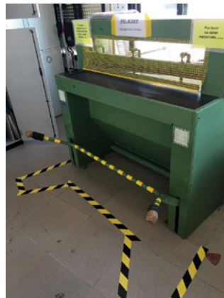
Tórculo con protección para evitar la caída de la pletina. | Cizalla con señales de advertencia. Ambos en el taller de grabado de la Facultad de Bellas Artes, Universidad de Sevilla, 2021.

No todos los talleres son iguales como tampoco lo son las ciudades, los países, en los que se ubican. No es lo mismo Gaborone que Nueva York. Probablemente los espacios de trabajo de la primera sean más contaminantes, pero mientras que la segunda luce unos estudios cero emisiones, la sociedad de consumo genera cada mañana toneladas de residuos plásticos. Lo sostenible en grabado no puede mantenerse ajeno a la manera con que el ser humano debiera realizar sus actividades cotidianas, desde limpiar un rodillo a comerse un yogur. La sostenibilidad es una actitud. Y aunque la idea de lo no tóxico y la ecología dirija nuestra actividad de estampadores, compete más a la gestión que a lo artístico, por lo que es fácil dejarla de lado. Así, toda acción es poca para airear los talleres con tufo a betún y aguarrás: «Echo de menos como olía el grabado antaño» se ha oído en una confusa nostalgia... me pregunto si Goya hubiera evitado su saturnismo de haberlo sabido; he conocido a grabadores que se quejaban por las emanaciones del ácido nítrico mientras terminaban el último cigarro de su cajetilla diaria.