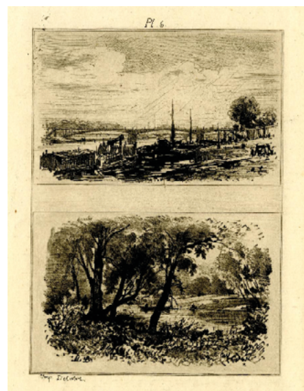
Henry Somm, Invitación a una velada con el coleccionista Mr. Philippe Burty , ca. 1880. Aguafuerte y punta seca, 30,4 × 20,6 cm., Van Gogh Museum, Ámsterdam. | Maxime Lalanne, Dos paisajes: Puente Solferino de París y Paisaje Boscoso ; ilustración del 'Traité de la gravure à l'eau forte' de Lalanne» (París: Cadart & Luquet, 1866) Aguafuerte. 183 × 116 cm. British Museum, Londres.

Mirando entre líneas, además de suponer el punto de partida del aguafuerte de creación, se descubre la puesta de largo de la estampación artística. La subrogación estética a los medios de reproducción y la suma de materiales, maquinaria y procesos dificultaban que el grabado incorporase las connotaciones emocionales de otras artes. Los pintores, atraídos por las capacidades gráficas de la tinta, le dieron el ánimo que faltaba. El grabado era dibujo sobre la plancha pero también podía ser pintura en la estampación.