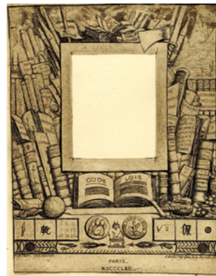
Rembrandt, Jesús cuidando a los enfermos o La estampa de los cien florines (detalle), ca. 1648. Aguafuerte y punta seca, 28,1 × 38,9 cm., British Museum, Londres. | Charles Meryon, Proyecto de encuadre para el retrato de Armand Guéraud , 1862. Aguafuerte y punta seca con entrapado, 16,7 × 13,4 cm. British Museum, Londres.

ve como la de tono bistre que a la larga pierde su brillantez y su intensidad, por lo que sólo debe aplicarse en las láminas que han sido enérgicamente mordidas, ni tan fuerte que dé a los trazos una dureza exagerada.» 5 Era un dispendio de sensualidad que parecía querer resarcirse de tanta austeridad secular.