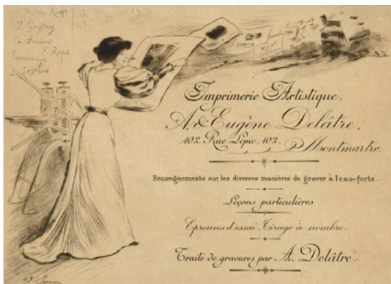
Léopold Flameng, Factura del taller de impresión artística de Delâtre , 1865. París, 1860. 26,7 × 19,9 cm. British Museum, Londres. | Henry Somm, Tarjeta de visita de los impresores Auguste & Eugène Delâtre , 1902, Aguafuerte, punta seca y buril, 1902. Van Gogh Museum, Ámsterdam.

Desde el punto de vista técnico, la belleza de la estampa se fundamentó en desarrollar los recursos de la estampación, sobre todo de los matices, difíciles de conocer por alguien ajeno a la práctica. La relación entre la tinta y el papel cobró importancia en tanto en cuanto sacaba partido al dibujo. Los estampadores añadieron tonalidades al negro, investigaron soportes y marcas de papeles 4 y lo relacionaron con la profundidad de la mordida; reaparecieron los vaporosos papeles orientales de color hueso que dulcificaban los tonos.