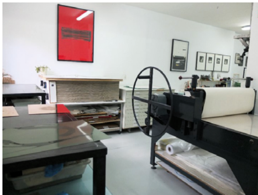
Abraham Bosse, Taller de impresión , 1642. Grabado, 32 × 38 cm. | Prensa de aplanado de aire al fondo. Taller Ogami Press. Madrid.

que ayudan a que éste seque en posición horizontal sin deformación. Estos secaderos funcionan bien con la serigrafía, xilografía y litografía, pero el grabado calcográfico necesita mucho peso encima. La desaparición de la humedad debe ser lenta en todos los casos.