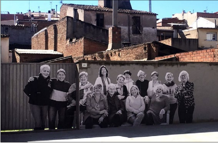
Imagen 1. Las catorce protagonistas de Bienvenidas al norte, bienvenidas al sur representadas en una obra mural realizada para el «docurreality» en Sant Vicenç dels Horts (Barcelona).

dels Horts (Barcelona), el municipio donde Oriol Junqueras fue alcalde. A continuación, se indican sus nombres: 1