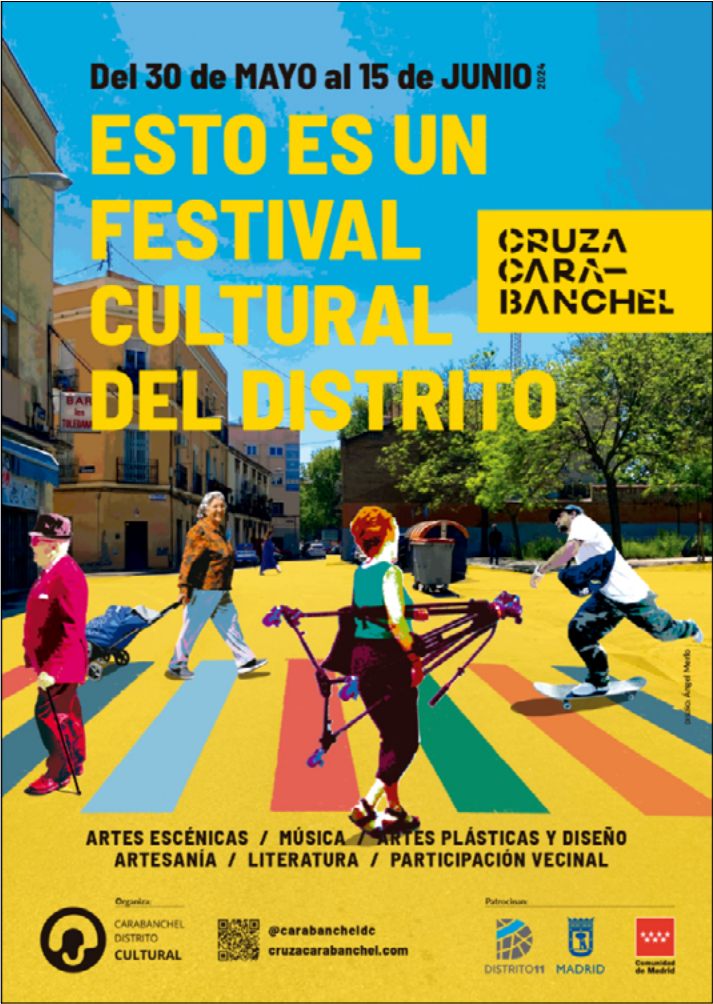
Imagen 3. Cartel del Festival Cruza Carabanchel.