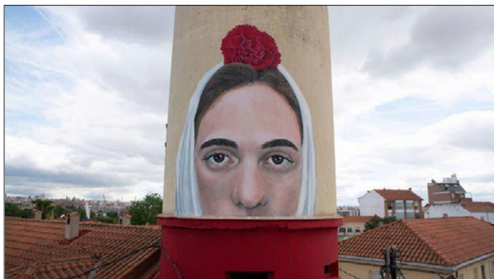
Imagen 6. Mural La Chulapa , de Jorge Rodríguez-Gerada.