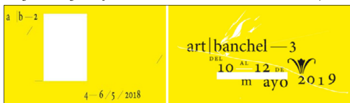
Imagen 2. Imagen corporativa de las ediciones de Art-Banchel de 2018 y 2019.