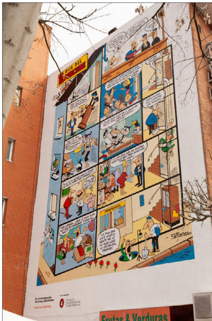
Imagen 7. Mural en homenaje a Francisco Ibáñez.