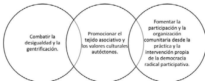
Figura 3. Posibles objetivos alternativos de los mapas.